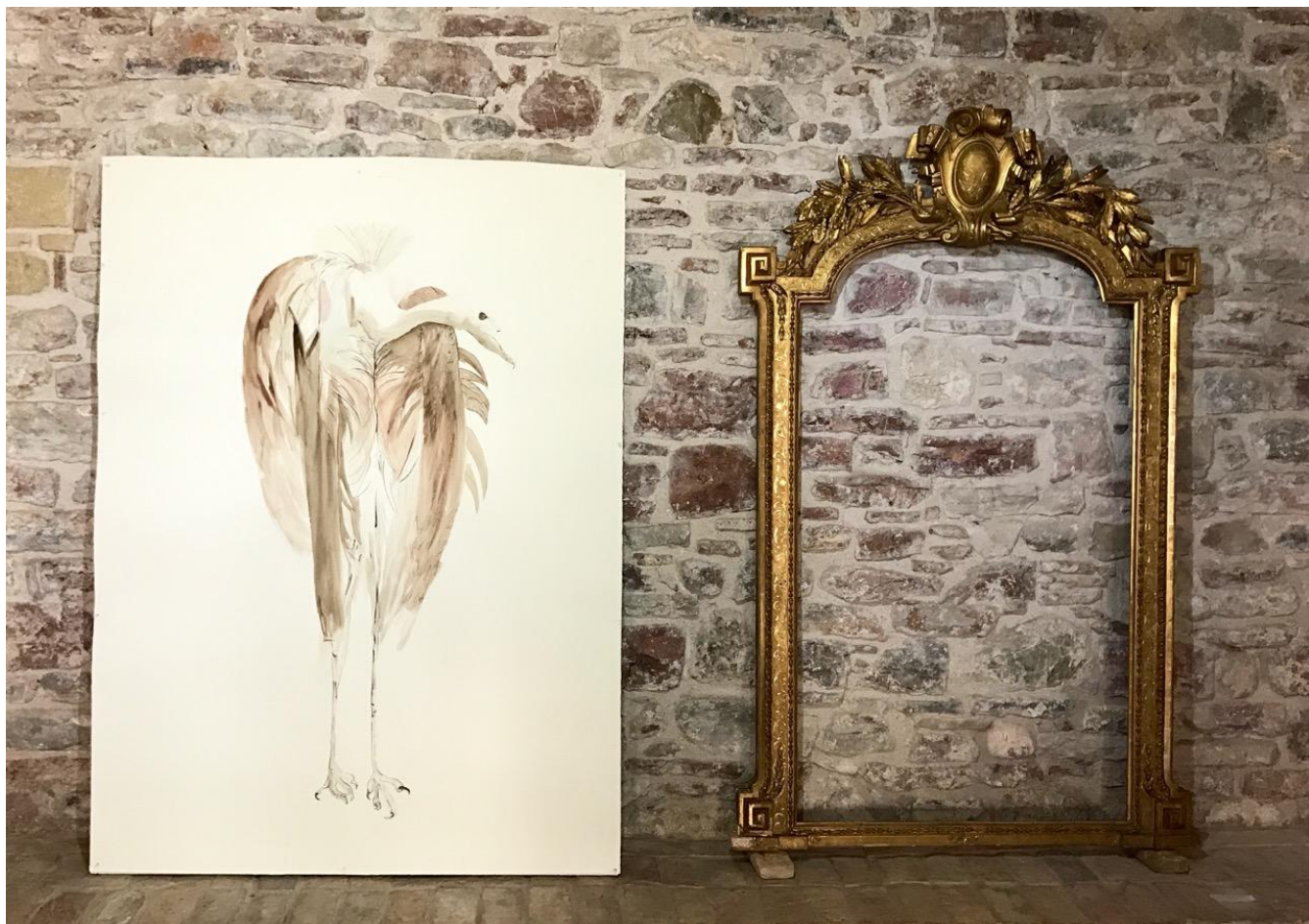
Μάρω Μιχαλακάκου, Head over heels_Narcissus (Νάρκισσος) , 2017 Μεικτή τεχνική, μεταβλητές διαστάσεις