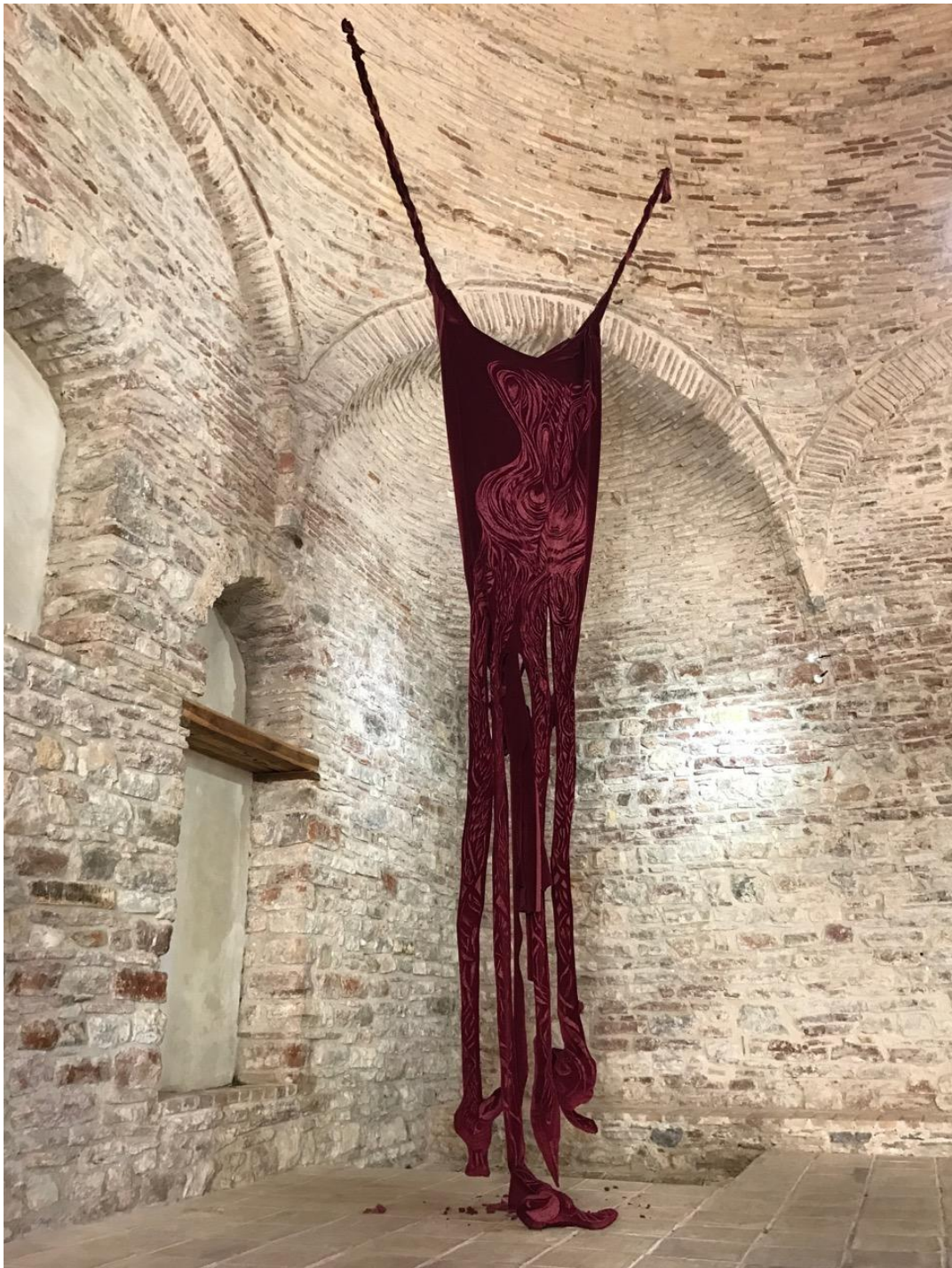
Μάρω Μιχαλακάκου, Eleni (Ελένη), 2015 βελούδο, μεταβλητές διαστάσεις ©Κωστής Σιφναίος Έργο κατ' ανάθεση του Πολιτιστικού & Αναπτυξιακού Οργανισμού κοινής ωφέλειας ΝΕΟΝ Δ.Δασκαλόπουλος