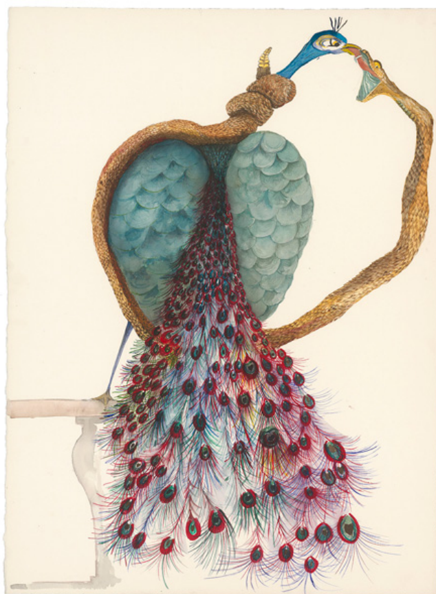
Μάρω Μιχαλακάκου, Parallel Universe (παράλληλα σύμπαντα) , 2009 ακουαρέλα σε χαρτί, 76 x 56 εκ, ιδιωτική συλλογή

Η δουλειά της, αιγιματική και πολυδιάστατη (γλυπτικές εγκαταστάσεις, ζωγραφική, σχέδια, ανάγλυφα σε βελούδο), «υφάινεται» με οικογενειακές μνήμες και πολιτιστικές αναφορές και χαρακτηρίζεται από μια σπάνια εκλεπτυσμένη ωμότητα. Επιλέγει φιγούρες και θεματικές που βρίσκονται πάντα σε τεταμένη κατάσταση, όπως η προστασία του οικογενειακού περιβάλλοντος και η επίπονη οικειότητα, ο έρωτας και η υποταγή, ο σύνδεσμος και τα δεσμά. Το καλλιτεχνικό σύμπαν της βρίσκεται στην άκρη των ονείρων, με μια φαινομενική ηρεμία σκόπιμα τοποθετημένη ανάμεσα στην πραγματικότητα και τη φαντασία.