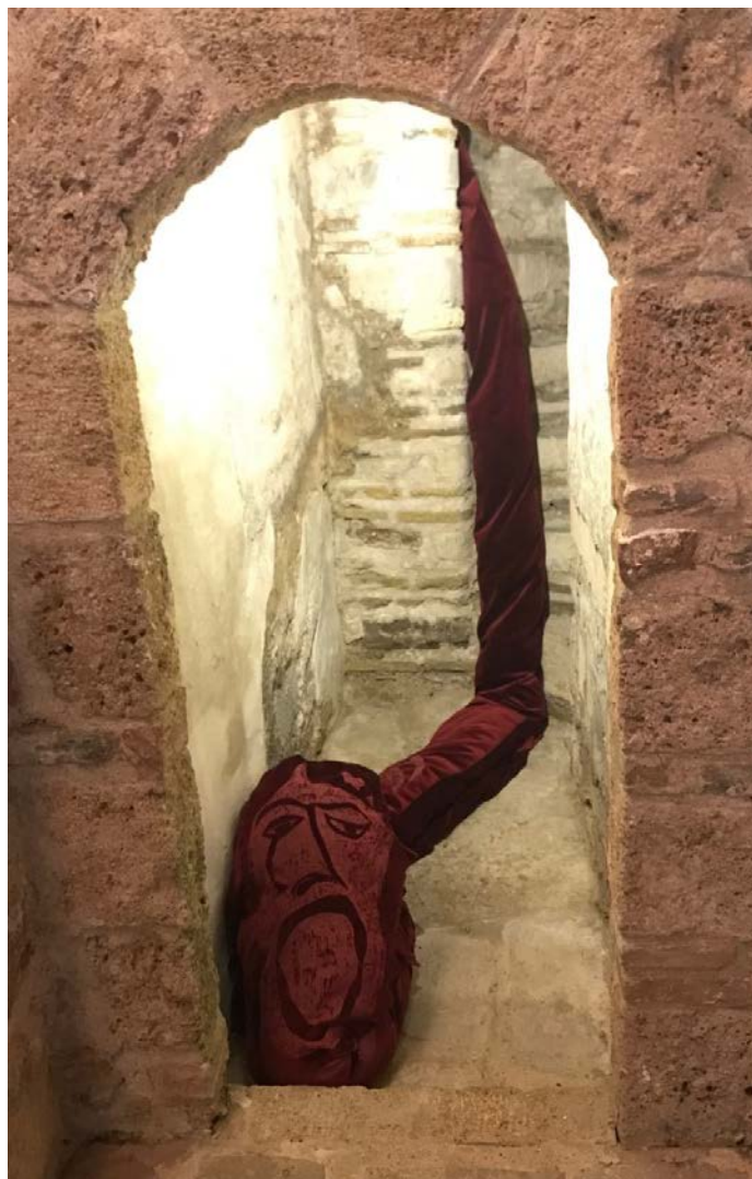
Μάρω Μιχαλακάκου, Regard carmin (πορφυρό βλέμμα) , 2016 βελούδο που βγαίνει από τη σκάλα του κατεστραμμένου μιναρέ, 300 x 40 εκ

Η πρόσβαση σε όλες τις εκδηλώσεις είναι ελεύθερη για το κοινό.